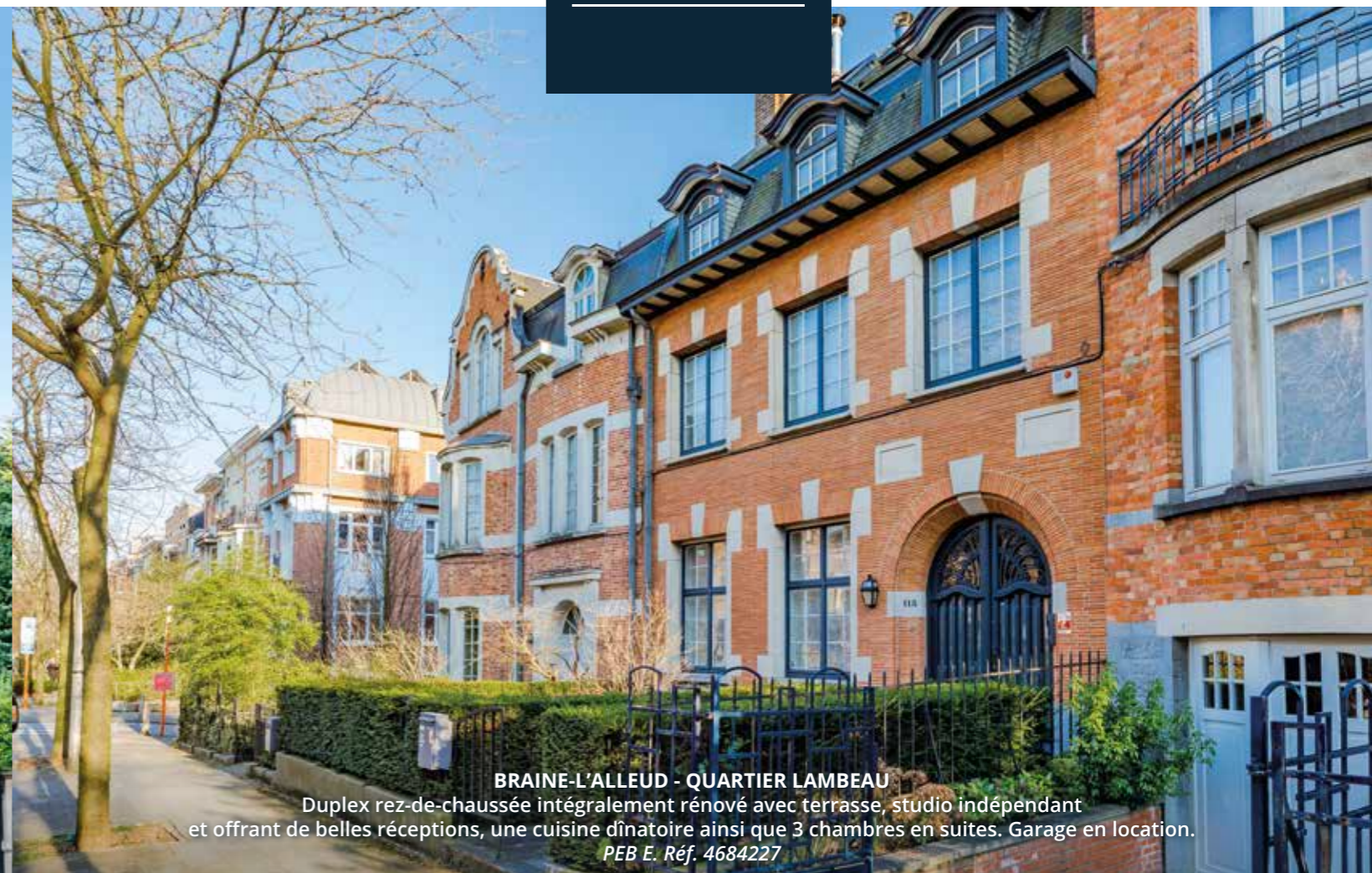
BRAINE-L'ALLEUD - QUARTIER LAMBEAU Duplex rez-de-chaussée intégralement rénové avec terrasse, studio indépendant et offrant de belles réceptions, une cuisine dînatoire ainsi que 3 chambres en suites. Garage en location. PEB E. Réf. 4684227