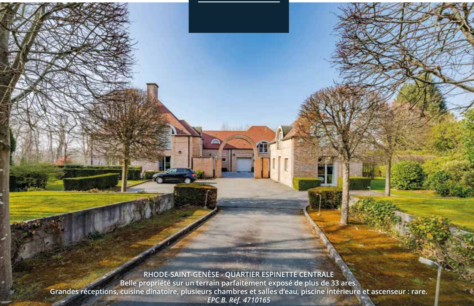
RHODE-SAINT-GENÈSE - QUARTIER ESPINETTE CENTRALE Belle propriété sur un terrain parfaitement exposé de plus de 33 ares. Grandes réceptions, cuisine dînatoire, plusieurs chambres et salles d'eau, piscine intérieure et ascenseur : rare. EPC B. Réf. 4710165