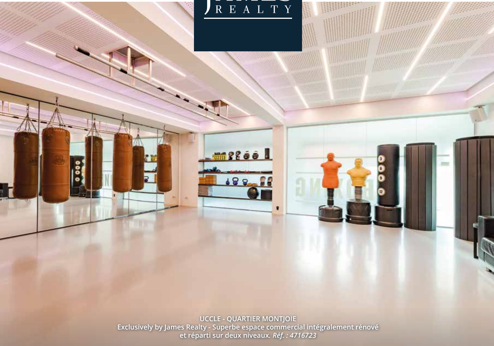
UCCLE - QUARTIER MONTJOIE Exclusively by James Realty - Superbe espace commercial intégralement rénové et réparti sur deux niveaux. Réf. : 4716723